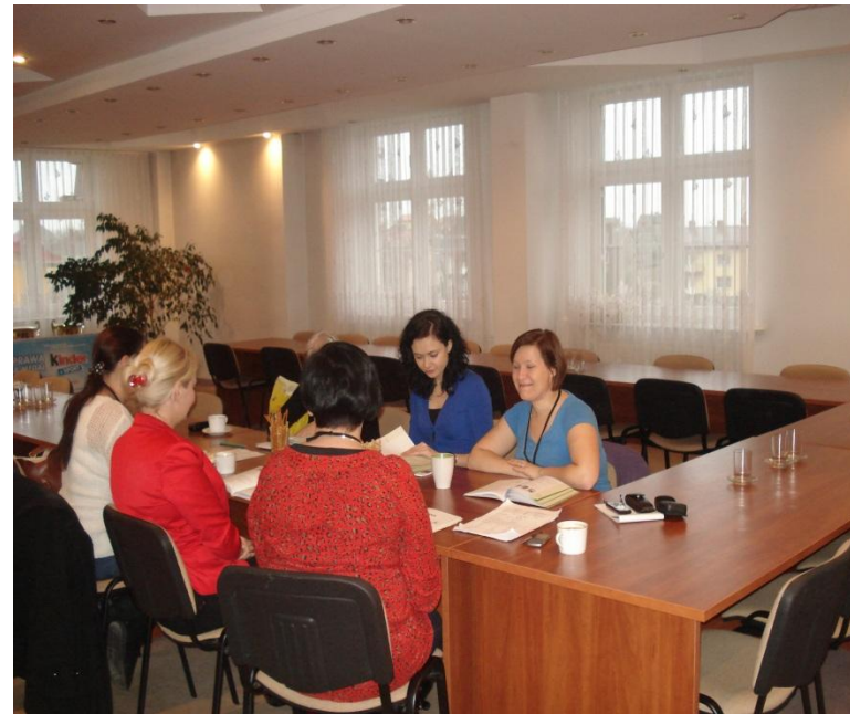
Szkolenie język angielski

Szkolenia te już także są realizowane . Uczestnicy podobnie jak w przypadku innych szkoleń otrzymali materiały szkoleniowe a w trakcie zajęć otrzymują poczęstunek.