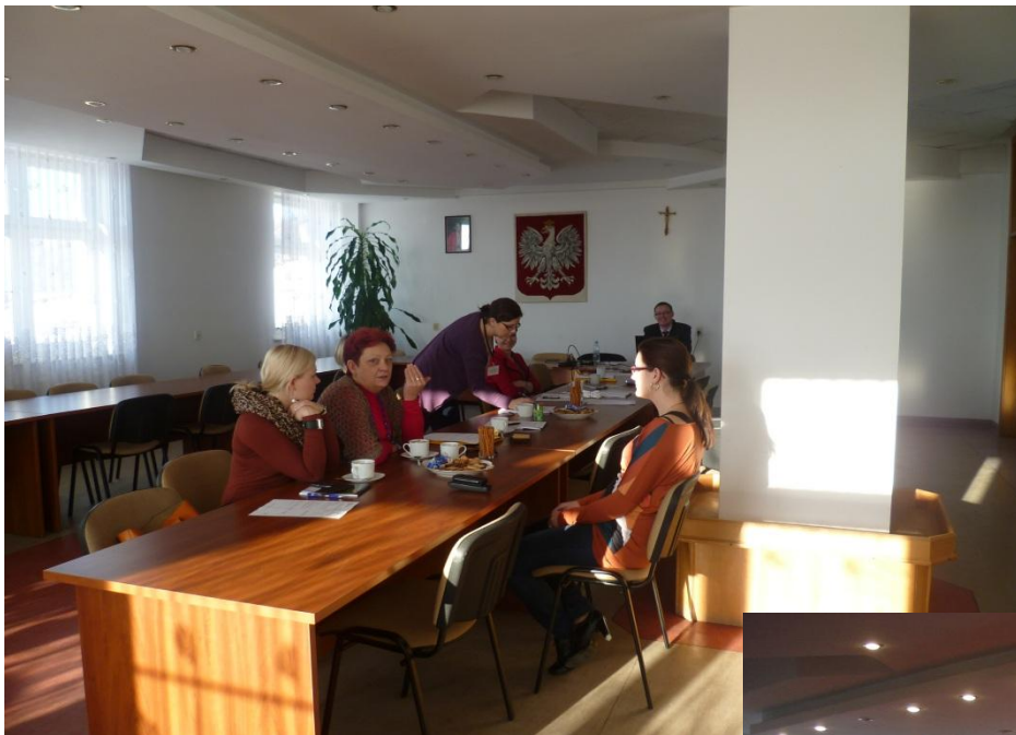
Szkolenie z zarządzania finansami