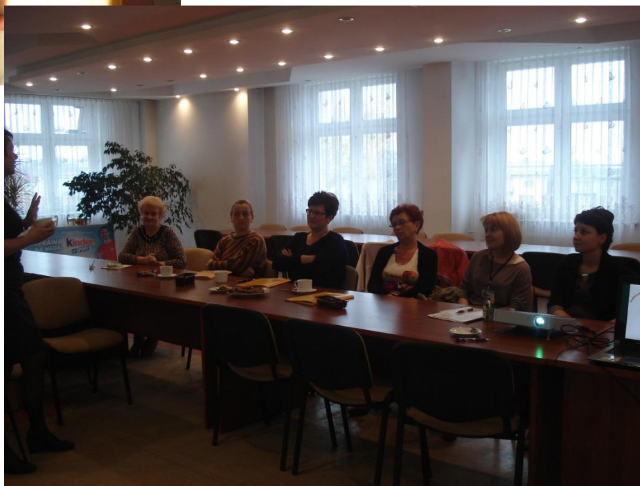
Szkolenie z podatków